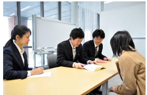
法律相談イメージ写真